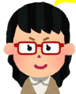
スマイル ステップ