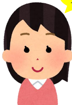
スマイル ステップ