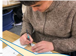
マルシェ出店 準備中♪