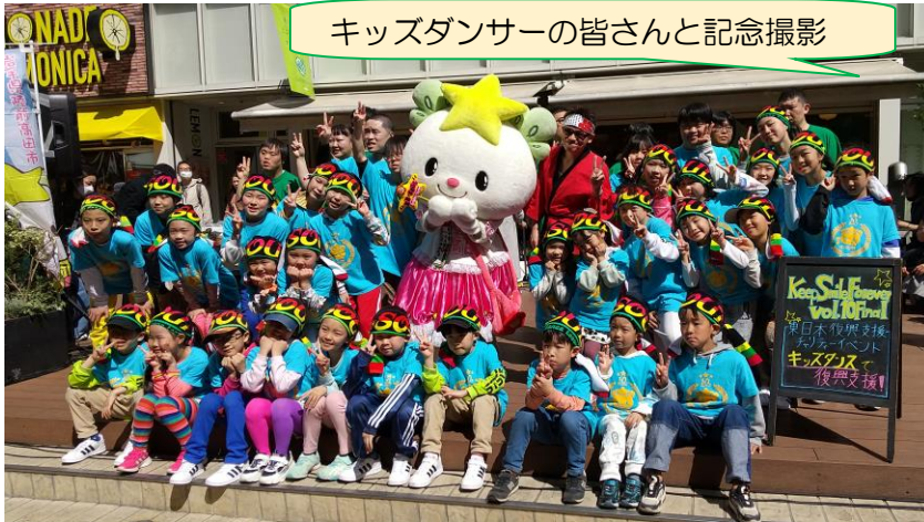
キッズダンサーの皆さんと記念撮影

3月19日（日）、美しい青空の下、コピス吉祥寺で、子どもたちの手による、東日本大震災復興支援チャリティーイベント「Keep Smile Forever vol.10 Final」が開催されました。