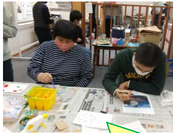
プラバンアクセサリー作り