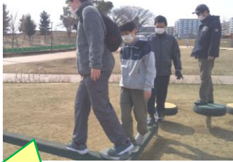
公園でウォーキング

先月から続いて行ったネックストラップ作業を通して、日々の作業の中でも新しい体験をして経験を積むことの大切さを感じています。4月からも、作業、体を動かすこと、アート活動などを組み合わせながら、利用者さんに新しいことにも少しずつチャレンジしてもらい、楽しく過ごしていただきたいと思っています。（福森）