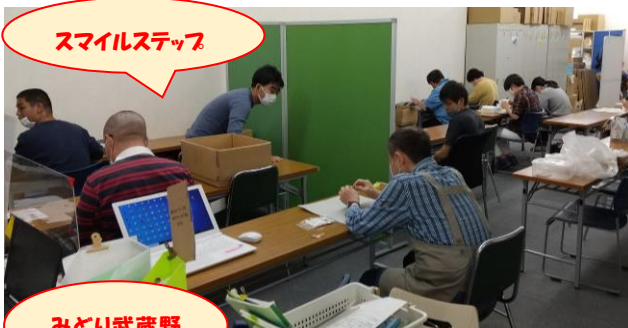
スマイルステップ

ゆうあいセンターでは「みどり西東京」の新設に合わせ、武蔵野市のゆうあい製作所でも、移転とリニューアルを行いました。