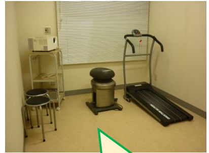
プロジェクターや 運動器具も！