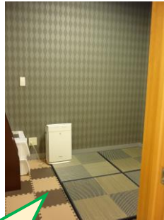
落ち着ける小部屋 多目的室 A