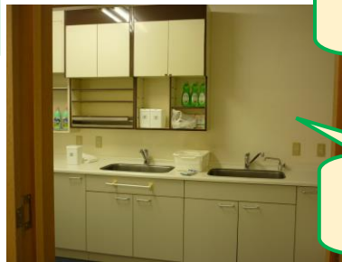
使い勝手のいい キッチン