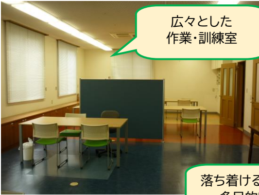
広々とした 作業・訓練室