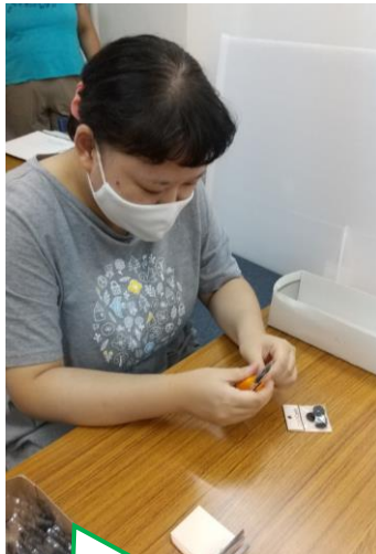
台紙ホチキス止め